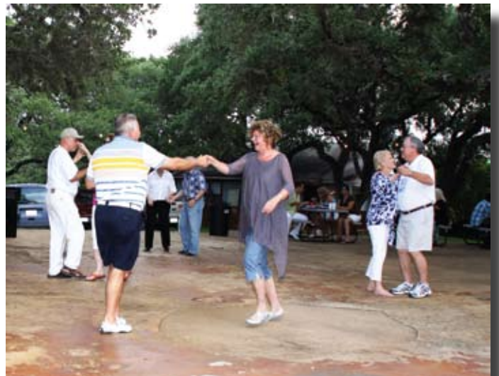
« Rock'n'roll »