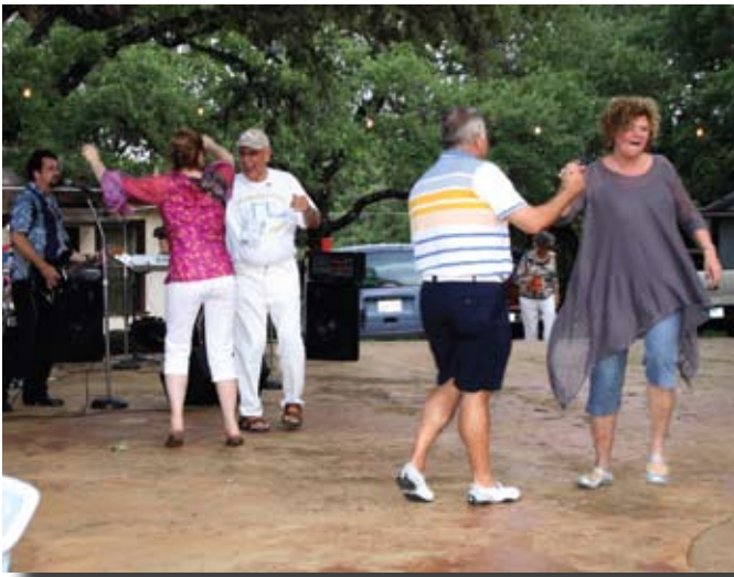
« Swinger votre compagnie »