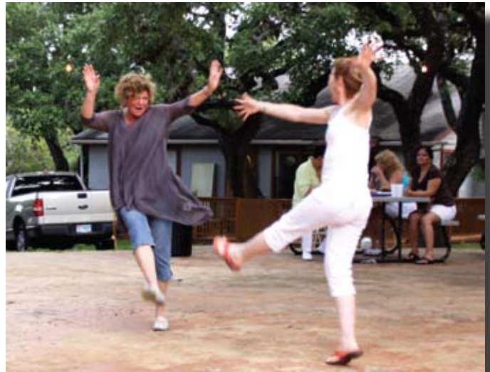
Du grand ballet