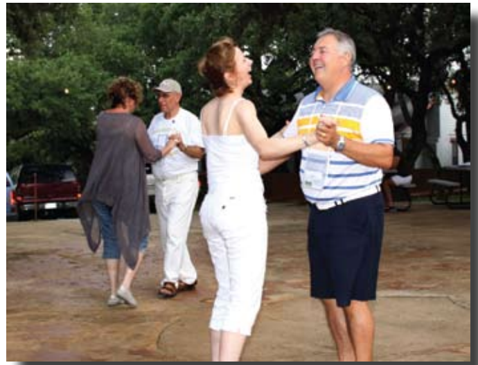
« Slow »