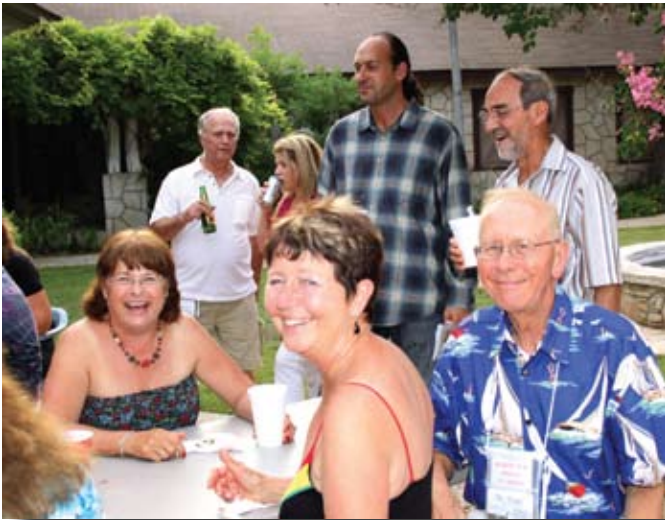
Visages en fête