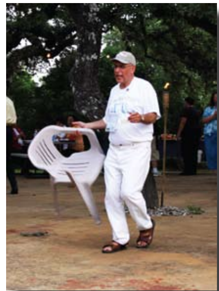
Danse de la chaise