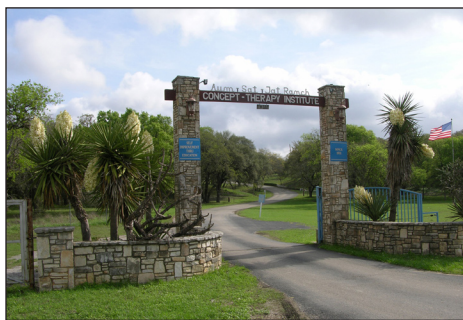
LE BEAMER, Hiver – Printemps 2010

Suivi par un cours International de Conceptologie Phase III 6 - 8 juillet 2010